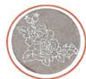
<メモリープレート>